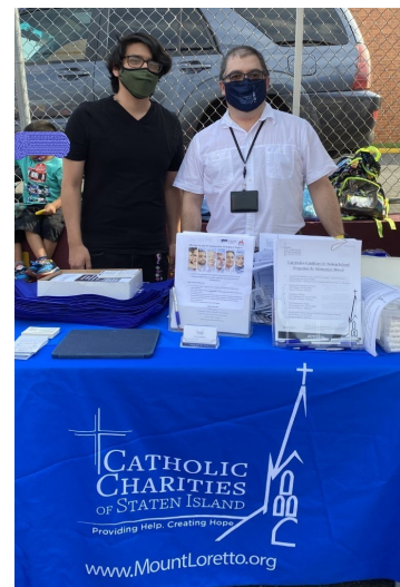
Catholic Charities de Staten Island y Manhattan participaron en la Celebracion de la Independencia de Mexico Organizada por la Parroquia de Monte Carmelo, Setiembre 15, 2021

https://aacdhseny49.org/grupos-staten-island